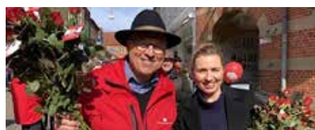
EU og Gram – veteranen spænder over det hele Side 12