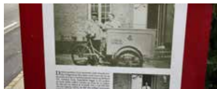
Borgermøde om fremtiden i Gram Side 13